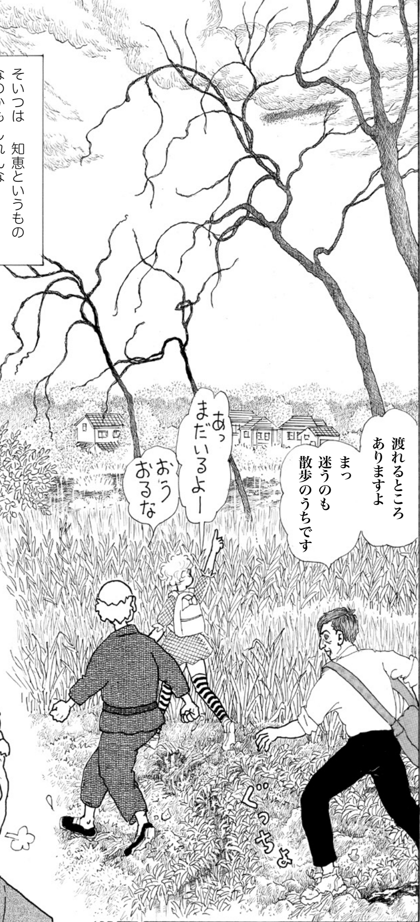
空き家に棲むふしぎな猫 その7 おわり

母船とやらなあ… 丘に登るまで 何故、気づかなか ったのか 人は無意識にも 見て見ぬふりか