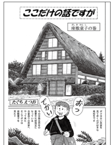
ここだけの話ですが 座敷童子の巻 たぐちえつお