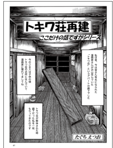
ここだけの話ですが トキワ荘再建 たぐちえつお