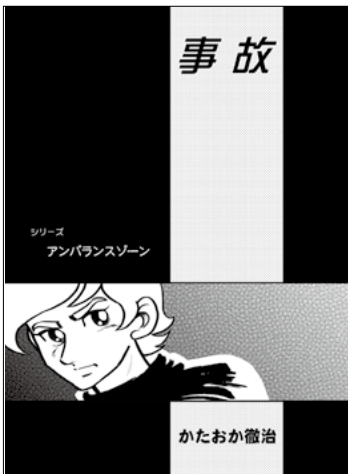
シリーズ アンバランスゾーン 事故 かたおか徹治