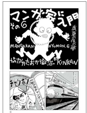
マンガ家入門 その6 KINKAN