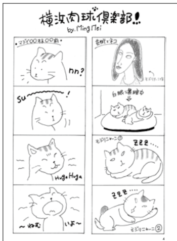
横浜肉球倶楽部 MING MEI