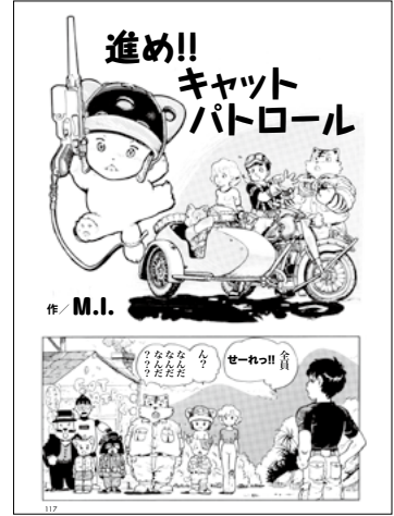
進め!! キャットパトロール M.I.