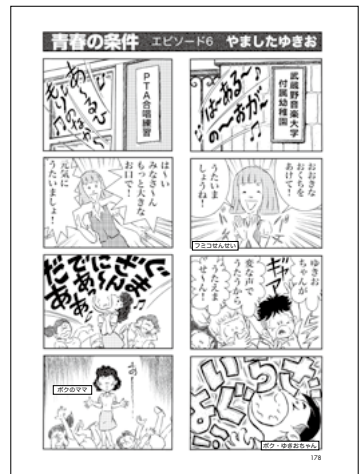
青春の条件 エピソード6 やましたゆきお