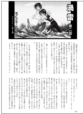
渦雷 第二話 文：レイラ・アズナブル イラスト：エーカ