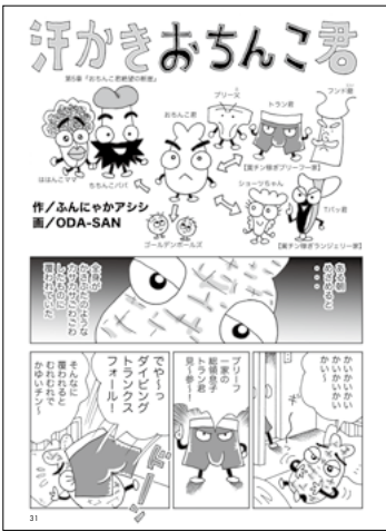
汗かきおんこ君 作・ふんにやかアシシ 画・ODA-SAN