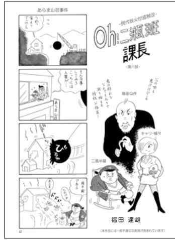
OH! 二瓶班課長 福田達雄