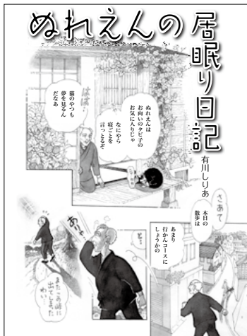
ぬれえんの居眠り日記 有川しりあ