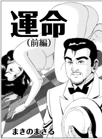
運命 (前編) まきのまさる