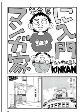
マンガ家入門 その5 KINKAN