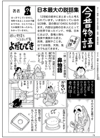
今昔物語 よだひでき