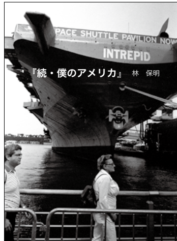
『続・僕のアメリカ』 林 保明