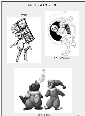
M.I. イラストギャラリー M.I.