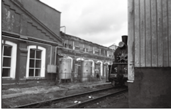
『僕とロシアの物語』 林 保明