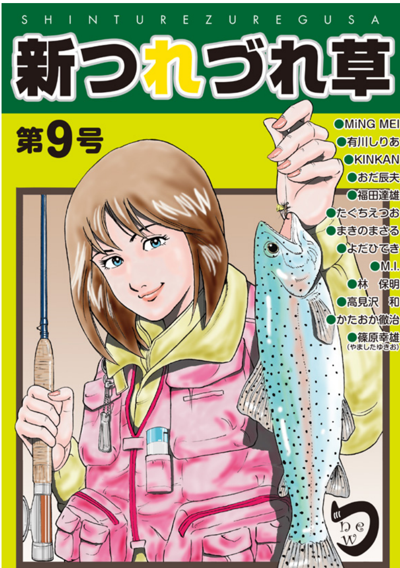
表紙イラスト・まきのまさる

巻末に掲載した、かたおか徹治の「闇夜の牙」はオリジナルのデビュー作、篠原幸雄の「ともだち」は初期の代表作。