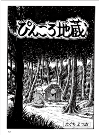
ぴんころ地蔵 たぐちえつお