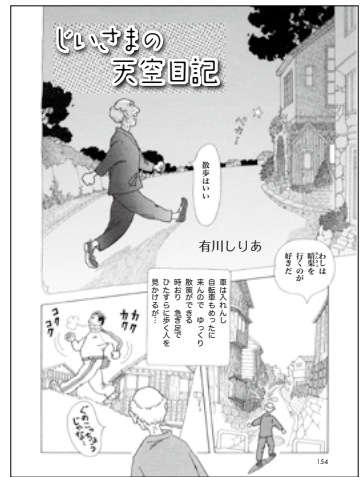
じいさまの天空日記 有川しりあ