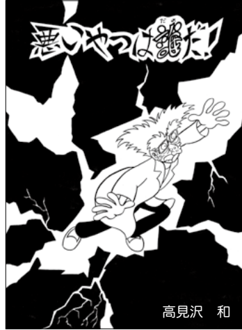
悪いやつは誰だ! 高見沢 和