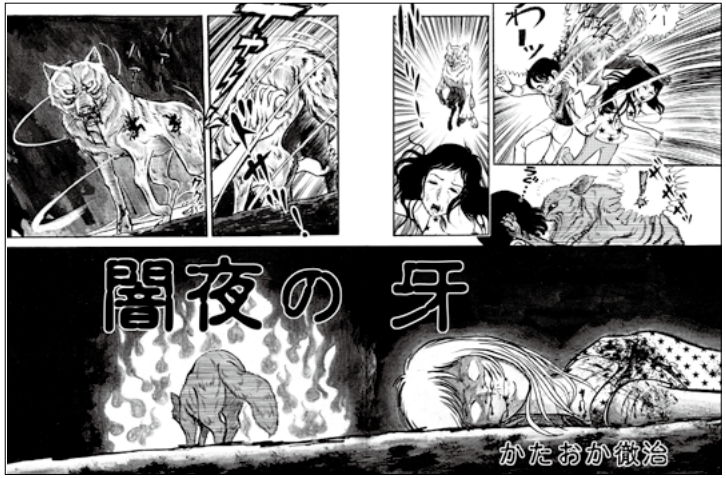
闇夜の牙 かたおか徹治