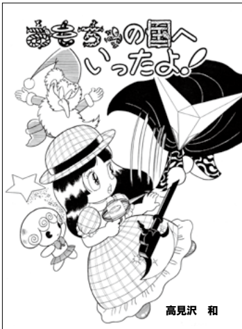
おもちゃの国へいったよ! 高見沢 和