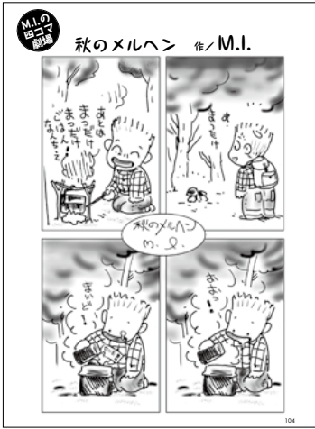
M.I. の四コマ劇場 M.I.