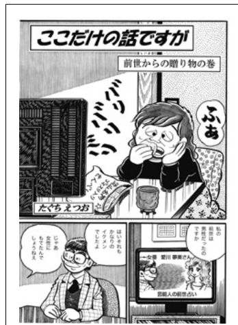
ここだけの話ですが 前世からの贈り物の巻 たぐちえつお