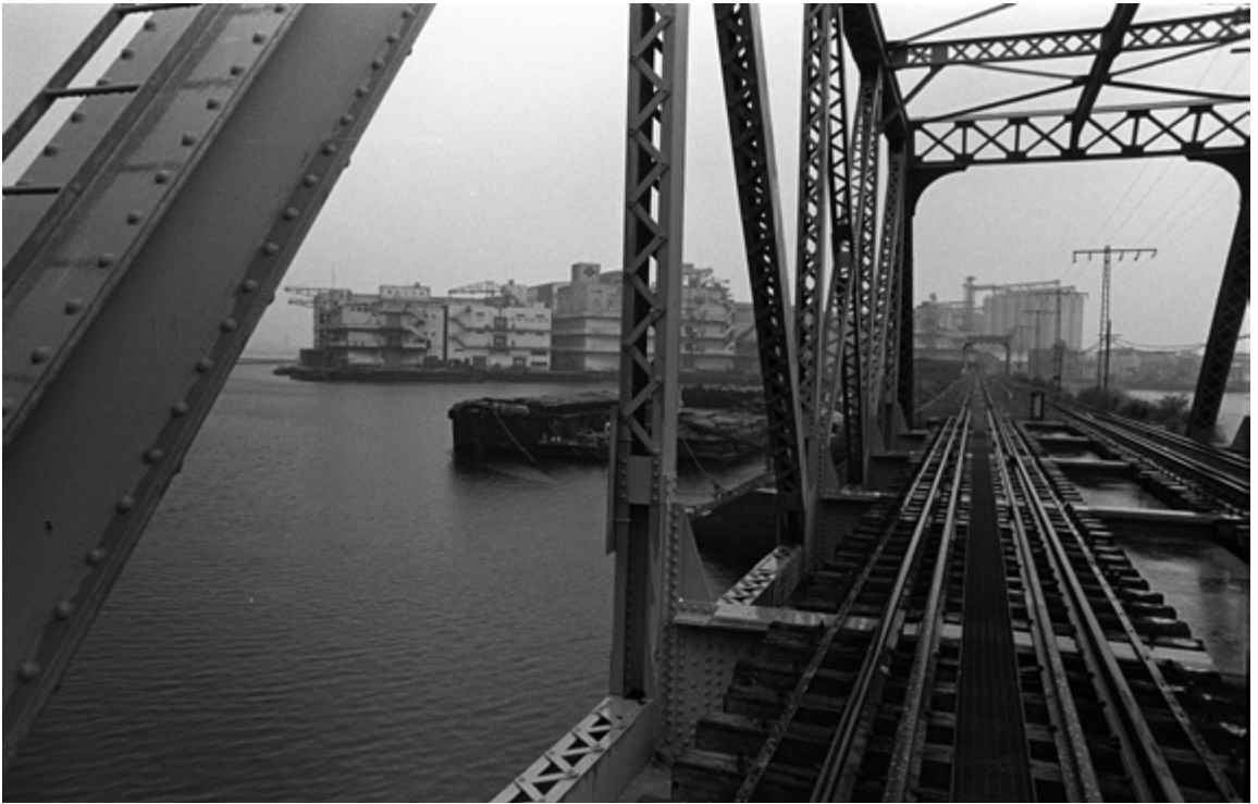
この先が戦前、太平洋航路の汽船「氷川丸」が出ていた新港埠頭です。（1983）