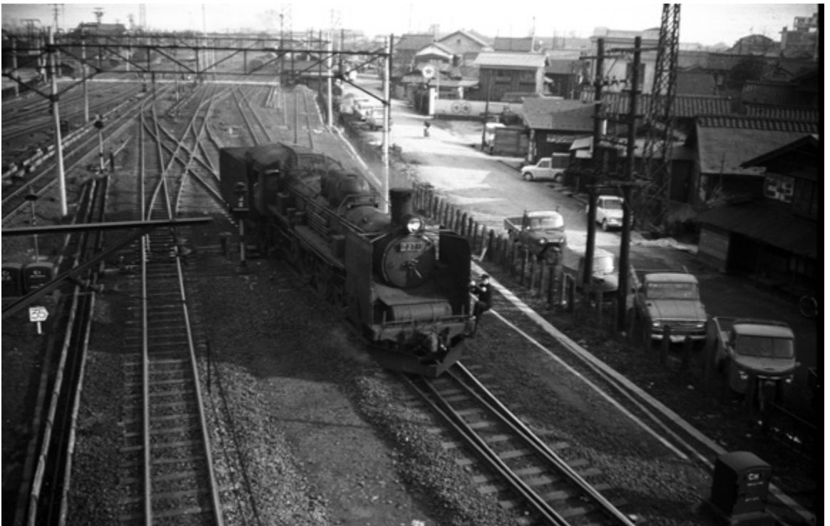
新潟県の新津と言う駅は、昔も今も、交通の拠点なのです。