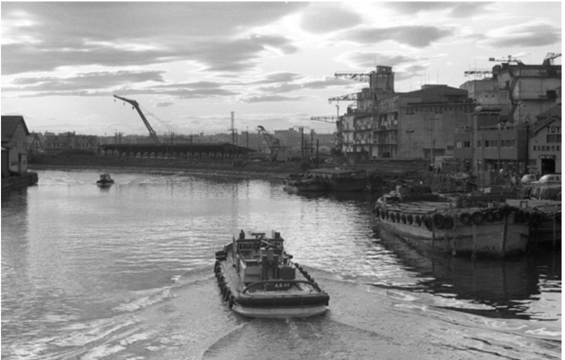
万国橋から見た風景です。貨物船から荷物を陸揚げする「はしけ」が活躍していました。