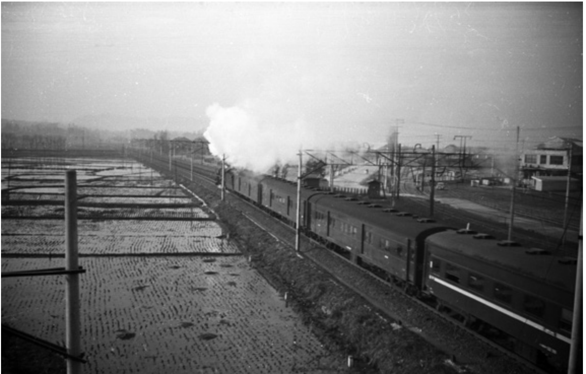
新津で別れる信越本線の列車は荷物車と一等車が入った長い編成でした。