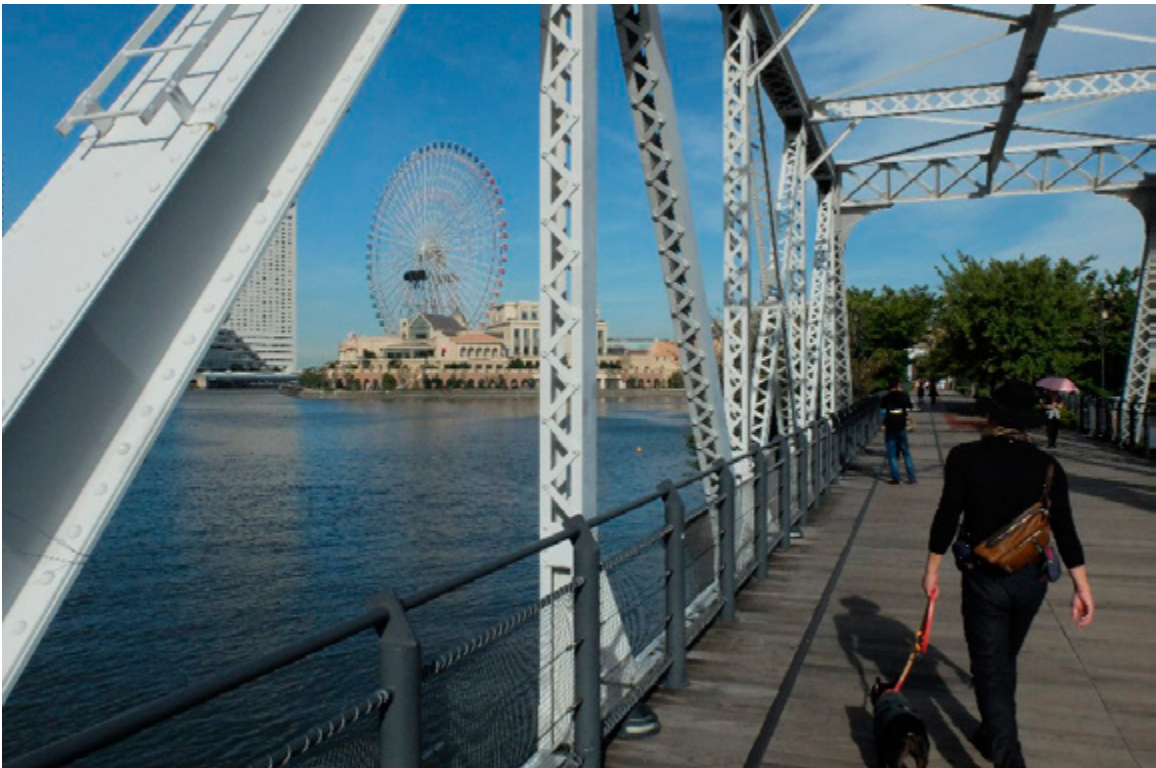
今は「自動車道」と言う遊歩道になっています。（2014）