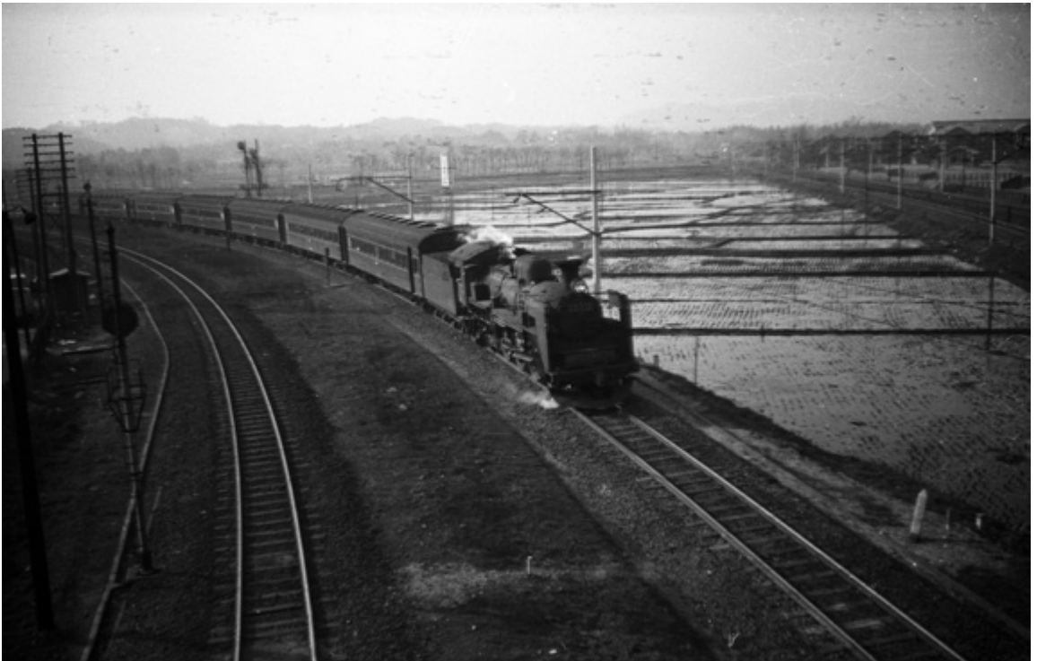
郡山と新津を結ぶ磐越西線の普通列車はC57型蒸気機関車が引いていました。（1964）