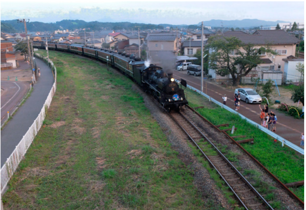
今も季節ごとに運転される『SLばんえつ物語』号もC57が引いています。（2014）