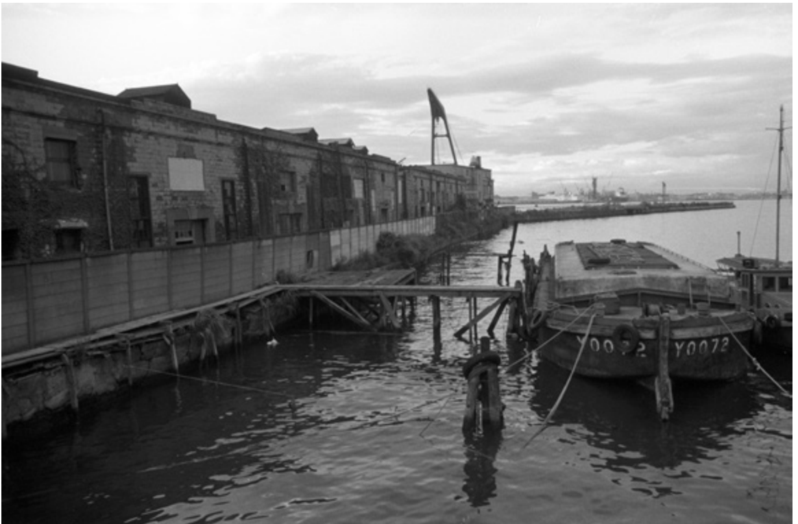
この左側に今は、帆船『日本丸』が係留されています。