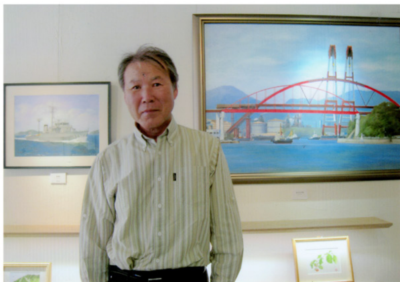
思い入れのある作品と (掃海艇と第二音戸大橋)

ある日、山に登って風景を見た時すごく描きたい衝動に駆られた。 その時から絵画に目覚め夢中になっていった。