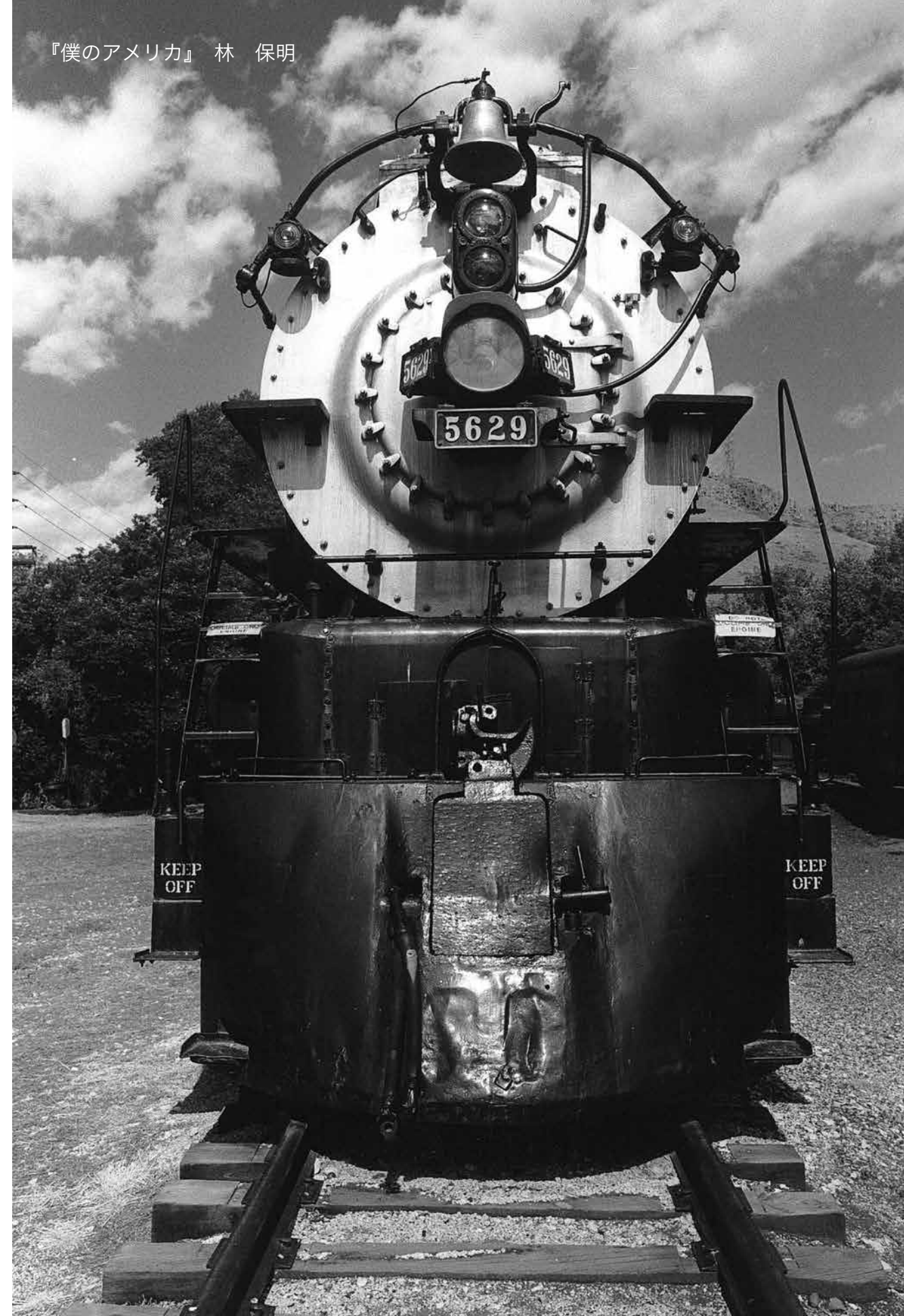
『僕のアメ리카』 林 保明